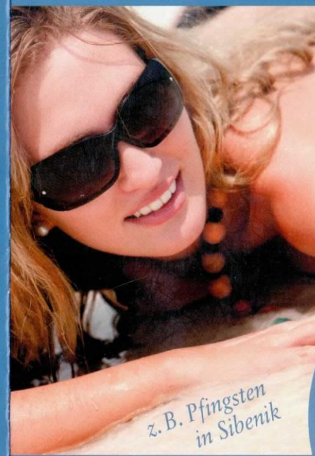
z. B. Pfingsten in Sibenik