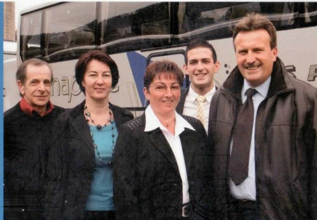
„Besonnen, rücksichtsvoll und höflich“, lautet das Motto des Teams von Menapace-Reisen.

Neben unserem Angebot an Urlaubsreisen, die Sie in diesem Folder finden, organisieren wir für Sie auch gerne individuelle Urlaubs- und Gruppenreisen sowie Firmen- und Vereinsausflüge. Wir legen großen Wert auf die Auswahl der Hotels und die Zusammenstellung des Programmablaufes, sodass Ihre Sicherheit und Ihr Wohlergehen stets im Vordergrund stehen. Unsere hochwertigen Busreisen zeichnen sich daher durch ein hervorragendes Preis-Leistungs-Verhältnis aus.