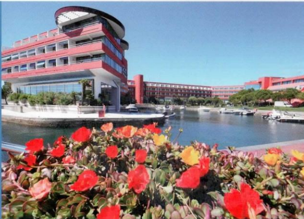
Das 4*-Hotel Histrion lässt keine Wünsche offen.

1.-3. April Frühlingsfahrt nach Portoroz Vier entspannte und zugleich unterhaltende Tage mit zweimal Halbpension im 4*-Hotel um nur € 162,-